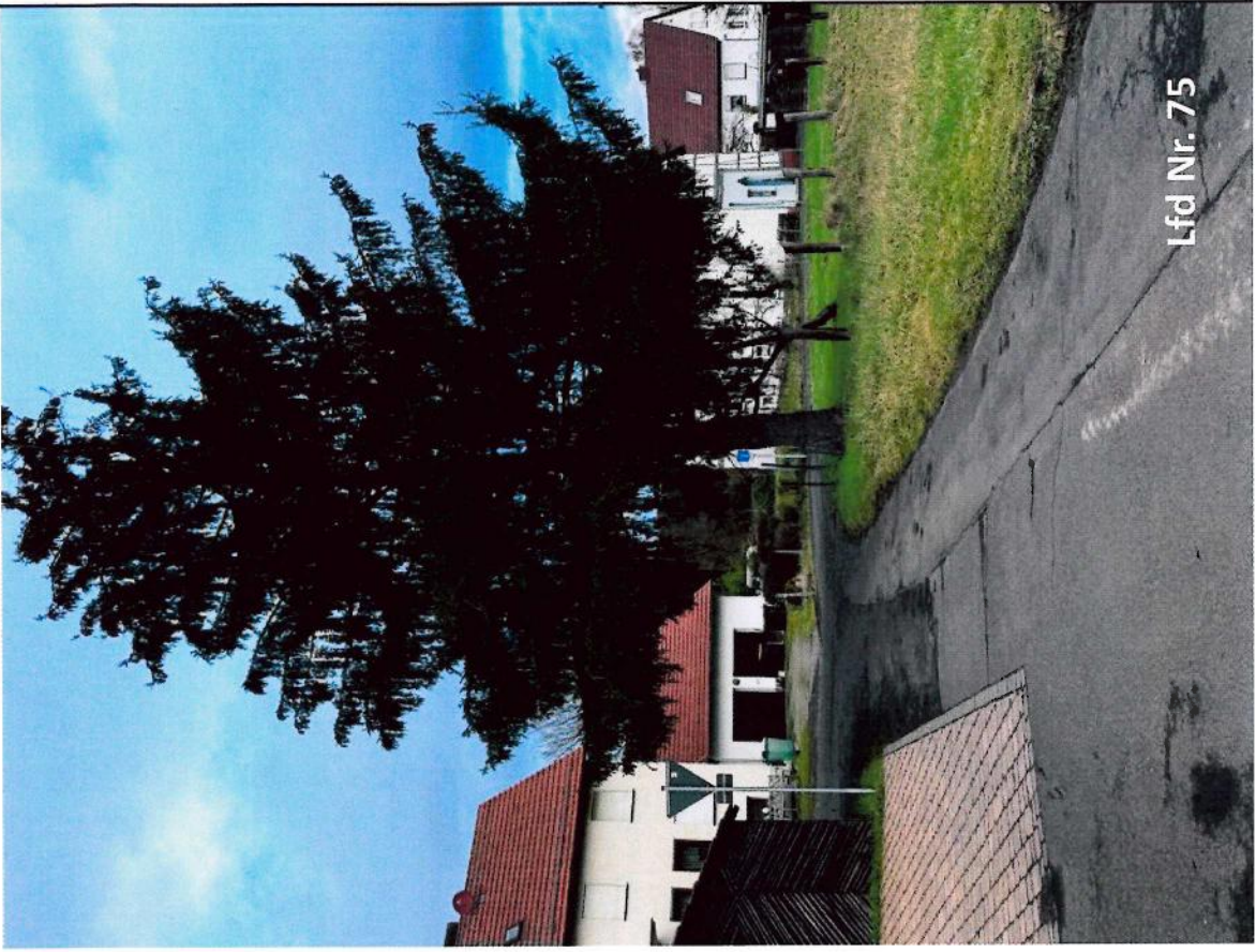
Lfd Nr. 75