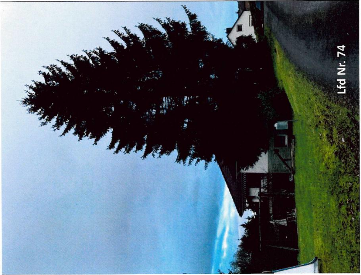
Lfd Nr. 74