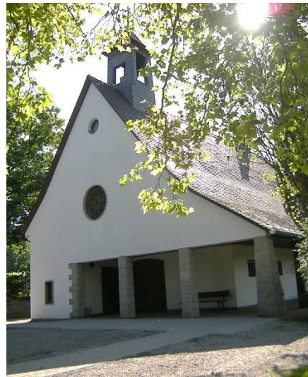
Friedhofs- kapelle Am Huberg in Melsungen

Dort erhalten sie auch Auskünfte über die verschiedenen Bestattungs- und Grabarten, die Gestaltung von Grabmalen und Einfassungen sowie die Höhe der Friedhofsgebühren.