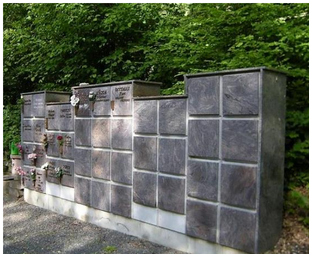
Beispiel Urnenwandkammer in Obermelsungen

Auf den Friedhöfen in "Obermelsungen" und "Schwarzenberg" sind Beistellungen in einer Urnenwandkammer möglich. Die Kammern werden als Wahlgräber behandelt. Die Nutzungszeit von 30 Jahren kann also auch verlängert werden. Sie dient der Aufnahme von 2 Urnen.