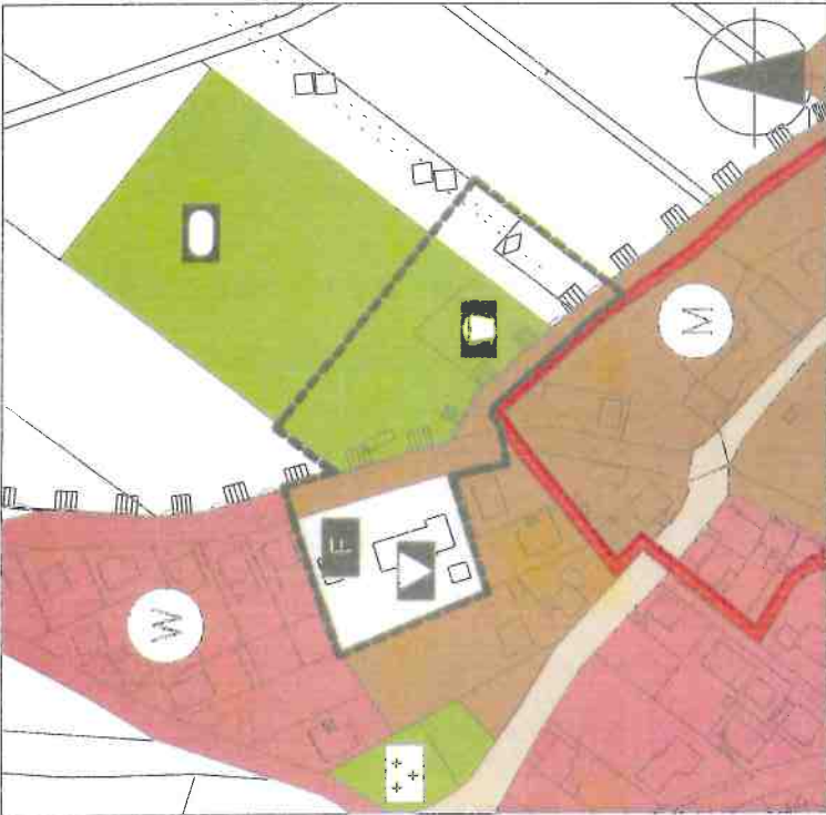
VOR DER ÄNDERUNG Maßstab 1:2000